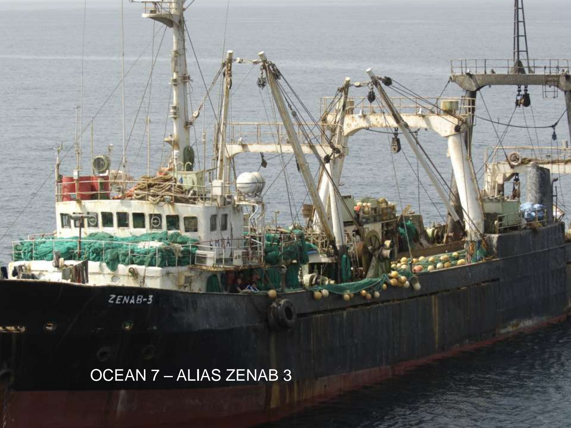
OCEAN 7 – ALIAS ZENAB 3