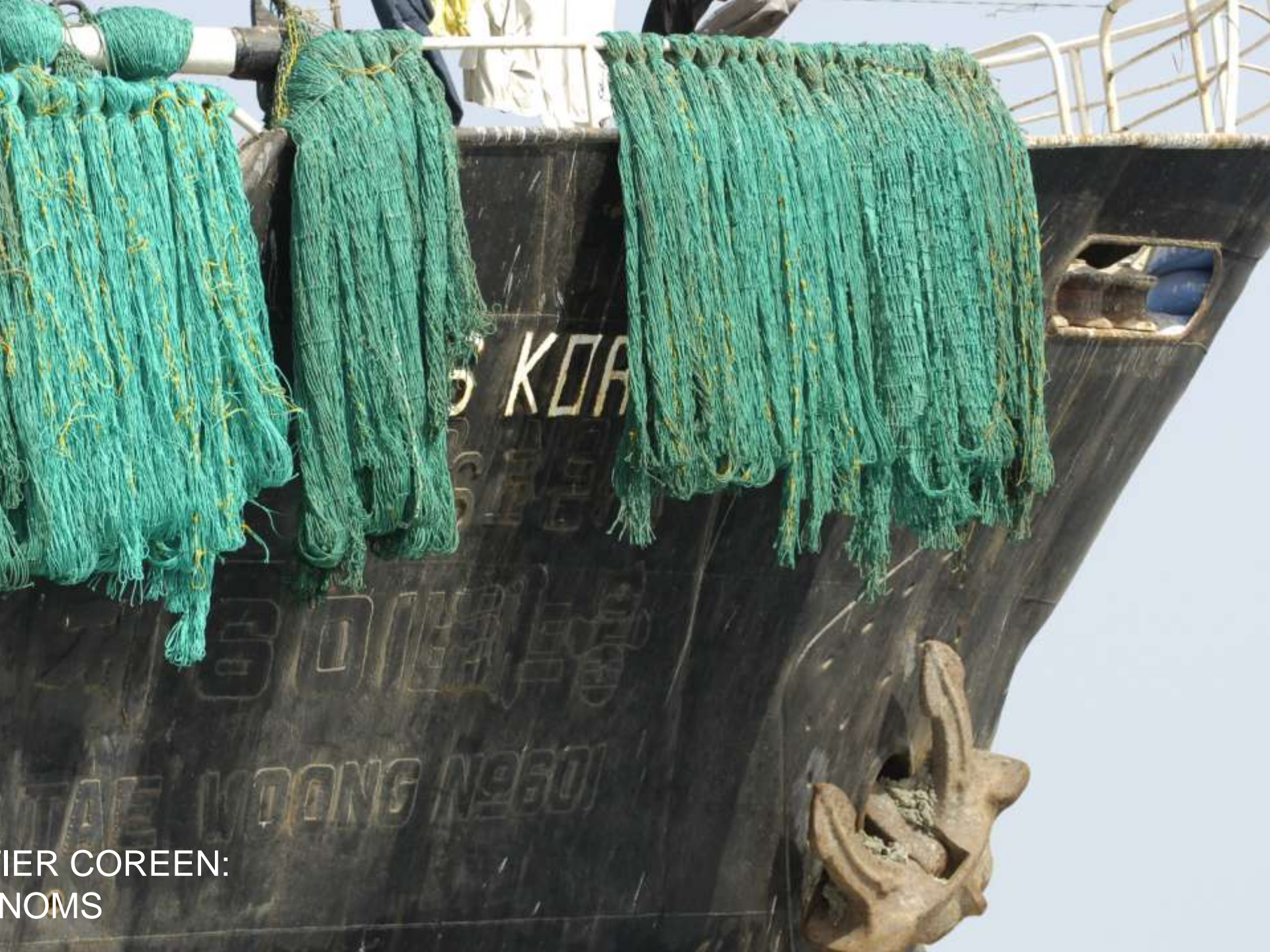
IER COREEN: NOMS